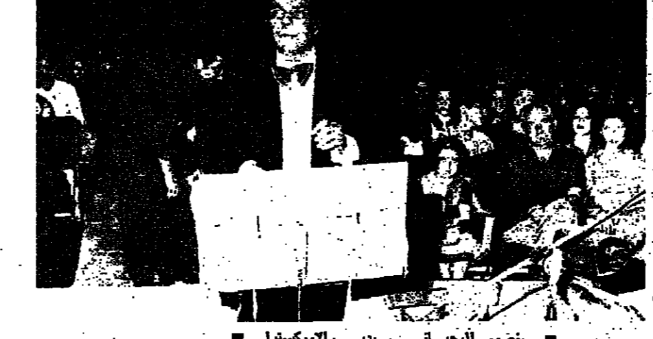
مخضور الرجائسي بينيرالوركسرا